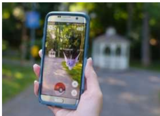
Рисунок 4 – Pokemon GO

Но не следует обольщаться возможными перспективами, так как появление нового ПО требует, чтобы на нем работали высококвалифицированные специалисты, ведь тот же искусственный интеллект и нейронные сети не решают задачи, они только предлагают варианты решений. А это приводит к тому, что для того чтобы выполнять операции компьютерного моделирования в строительстве и дизайне требуются большие затраты, как на обновление ПО и оборудования, так и на постоянное самосовершенствование специалиста на основе обучения на различных курсах. Профессиональное программное обеспечение позволяет дизайнерам и архитекторам создавать точные виртуальные модели и выполнять различные аналитические исследования и симуляции для повышения качества проектов и удовлетворенности потребности клиентов.