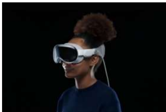
Рисунок 3 - Apple Vision Pro

Следующим примером может служить разработка компьютерных игр, например, игра Pokemon Go, рисунок 4. Особенность игры заключается в том, что, используя камеру телефона и систему GPS разработчики игры разработали виртуальную реальность объединив в нее реальную карту местности и виртуальных героев сделав их неотъемлемой частью ландшафта. Третьим примером стало использование искусственного интеллекта в системе проектирования, что позволило разработчикам уйти от рутины однотипных задач, а основные операции по моделированию ландшафта и элементов интерьера передать искусственному интеллекту. Данное направление на сегодняшний день является актуальным, так как позволяет разработчикам ПО внедрять в системы компьютерного моделирования функции интеллектуального поиска, внедрять алгоритмы самообучения и внедрить возможность в новые классы ПО функции аналитического решения на основе алгоритмов машинного обучения и нейронных сетей.