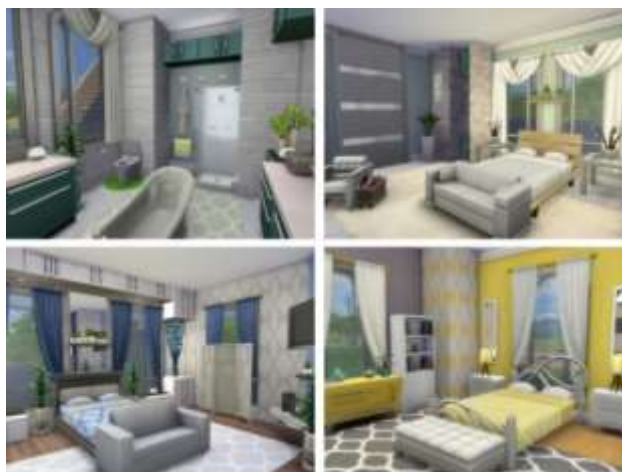
Рисунок 1 – Дизайн интерьера в игре Sims 4

Сейчас существует огромное множество программ для компьютерного моделирования и дизайна, но особо выделяются следующие: