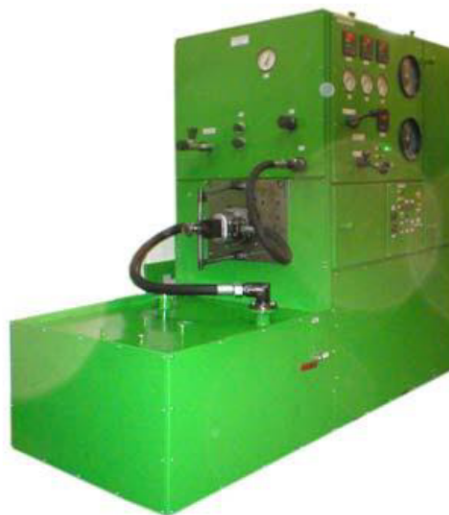
Рисунок 1 – Стенд КИ-4200 для испытания гидроприводов